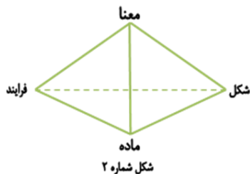
شکل شماره ۲

«چشم‌انداز معنا» به مضمون هدف‌دار فرآیند تغییر، حیات و جهت‌گیری آن نظر می‌افکند. مقررات رفتاری، ارزش‌ها، نیت‌ها، مقاصد، طرح‌ها، راهبردها و روابط قدرت در دنیای امر انسانی در نظام ارزش‌ها، روش‌ها، بینش‌های تغییر فردی، تغییر اجتماعی و آشکارگی آن در عرصه هنر، سامان می‌یابند و به این قرار مضمون جهتی مکتب تغییر را توضیح می‌دهند. پس، فهم کامل فرآیند حیات و تغییر، باید دربرگیرنده ترکیب چهار چشم‌انداز شکل، ماده، فرآیند و معنا باشد (نک: شکل ۲).