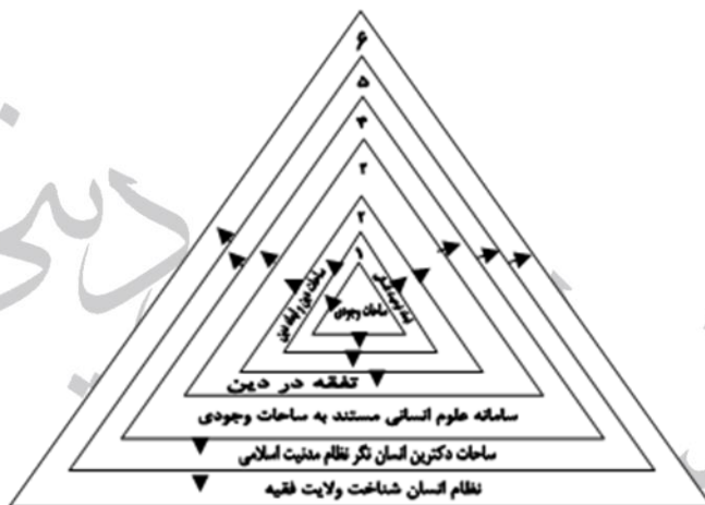
شکل شماره ۴: سطوح ساحات مرتب بر ساحات وجودی انسان و نظریه پردازی مطوف به آن

۵. رخداد مدنیت اسلامی در مقتضیات گوناگونی چونان مقتضیات جهان معاصر ایرانی، حاجت‌مند نوعی الگوی کلان پیشرفت است. ساختار عمومی این مدل عملیاتی کلان مستند به سطوح و ابعاد کلان‌نگر امر انسانی، ماهیت اصیل انسان‌شناخت خویش راه، در سه فصل «نقشه جامع علم»، «نقشه جامع آموزش و پرورش» و «نقشه جامع مهندسی فرهنگی» بیان داشته است. ۶. در سرجمع سطوح و لایه‌های دانشی - تدبیری مبتنی بر انسان‌شناسی پیشرفت، با نگره کلان‌ساحتی به انسان، نظام انسان‌نگر ولایت فقیه توجیه می‌شود.