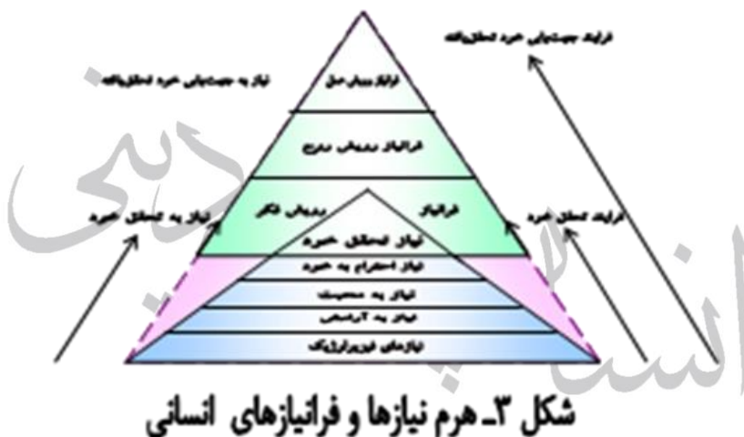
شکل ۳- هرم نیازها و فراتیازهای انسانی

با مروری بر آموزه‌های اهل بیت(ع)، می‌توان گفت ادعیه و نیایش‌های اهل بیت(ع) ژرف‌ترین جست‌وجوی زیستی آدمیان است. دست‌یابی به رشد و کمال، درونی‌ترین لایه تحلیلی نیایش‌های بشری است. خواهانی‌های اهل بیت(ع) سامانه‌ای جامع از فرآیندها است.